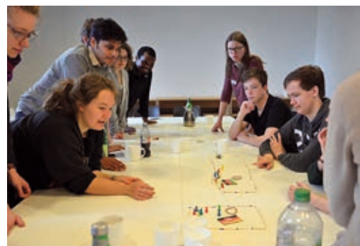
Bildungsarbeit in Deutschland