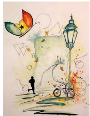
Unser gemeinsamer Weg, Zeichnung von Quynh Bui

www.ghanagermanypartnership.wordpress.com