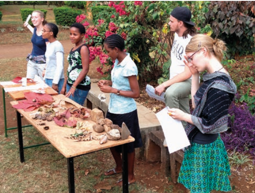
Tischtheater zum deutschen Kinderbuch „Frederick“