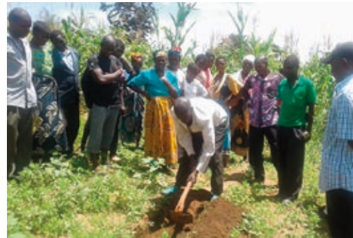
Ausbildung von Landwirt*innen in Malawi