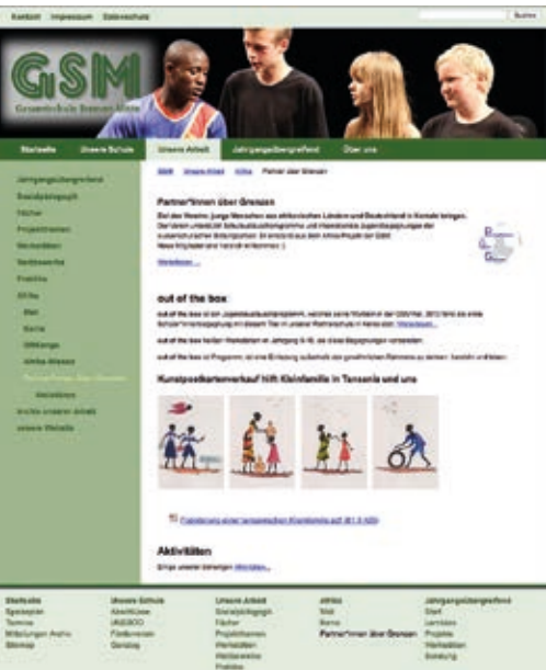
Website der Gesamtschule Bremen-Mitte, Deutschland mit Informationen zur Partnerschaft mit einem Verein in Nairobi, Kenia

Gibt es eine Website der Schule, des Vereins oder der Organisation? Neben wichtigen Informationen zum Projekt und seinen Förder*innen sollten hier auch Erfahrungsberichte zu finden sein. Vielleicht haben einige Teilnehmende auch einen eigenen Blog, in dem sie berichten wollen? Mit dem kostenlosen Programm Wordpress kann man außerdem sehr schnell eine eigene Website für das Projekt erstellen. So könnten die Berichte der Partnerorganisation auf der gleichen Plattform veröffentlicht werden. Bei gemeinsam erstellten Websites sollte stets klar erkennbar sein, wer Verfasser*in der einzelnen Texte ist. Auch hier gilt: Die Beiträge sollten eine übersichtliche Gliederung haben. Je Text sollte nur ein Thema behandelt werden, sonst wird er zu lang. Einzelne thematische Aspekte können mit Zwischenüberschriften verdeutlicht werden. Auf einer Website ist viel Platz für Fotos. Diese können z. B. in einer Fotogalerie zusammengestellt werden. Vielleicht sind auch kurze Videos entstanden, die hochgeladen werden können?