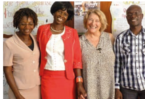
Koordinator*innen der Partnerschaft zwischen Blantyre und Hannover