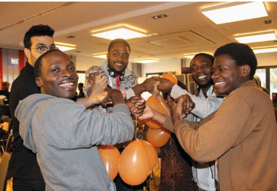
Konferenz-Teilnehmende vernetzen sich