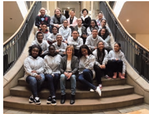
Südafrikanische Gäste in Deutschland 2019

www.t1p.de/partnerschaft-schafft-energie