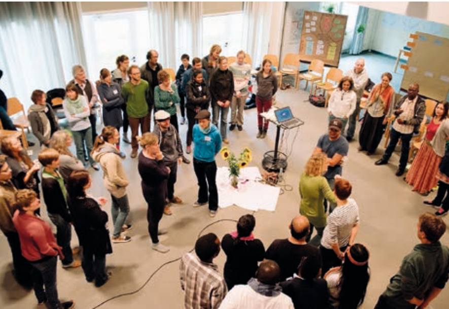
Treffen der Netzwerkmitglieder bei einer Konferenz 2017