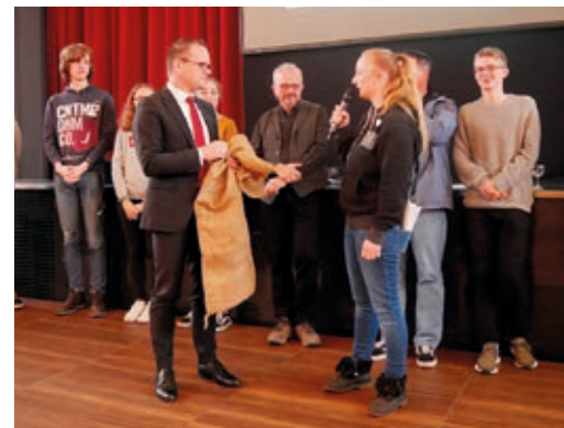
Peer-Leader übergeben Verbesserungsvorschläge für das Schulsystem an den niedersächsischen Kultusminister

Um diese Herausforderungen zu überwinden, plant PLI einen digitalen „Peer-Campus“, der zukünftig als offene Plattform für gegenseitige Informationen, Ideen und Aktionen dienen soll. So können aus kleinen Kooperationen große, wirksame Projekte für eine gemeinsame, nachhaltige Zukunft erwachsen.